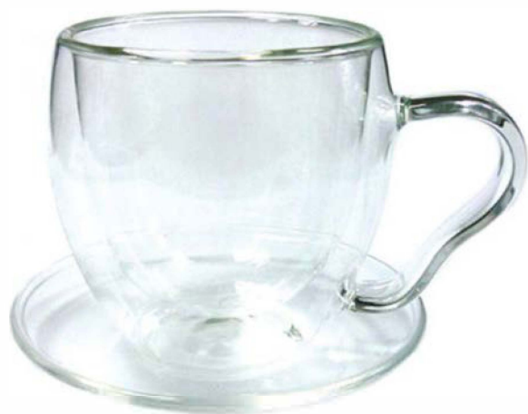
Чайная пара «Канны»