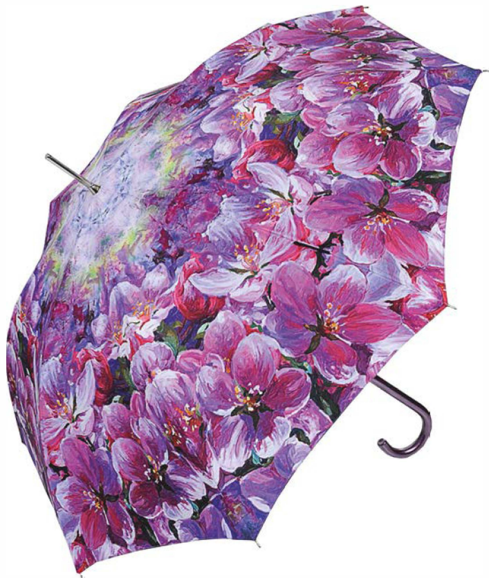
Зонт-трость от Вячеслава Зайцева