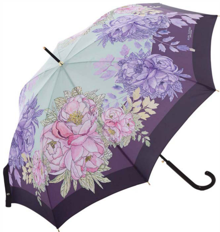
Зонт-трость от Вячеслава Зайцева