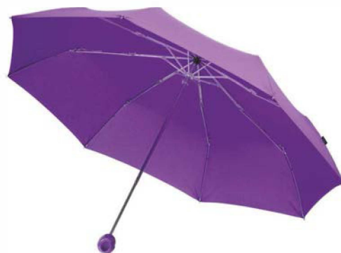
Зонт складной Floyd с кольцом