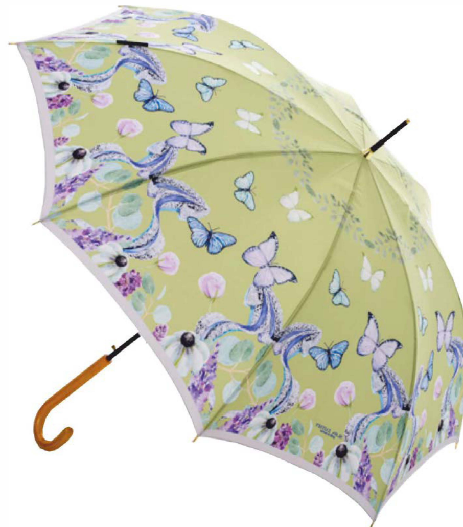
Зонт-трость от Вячеслава Зайцева