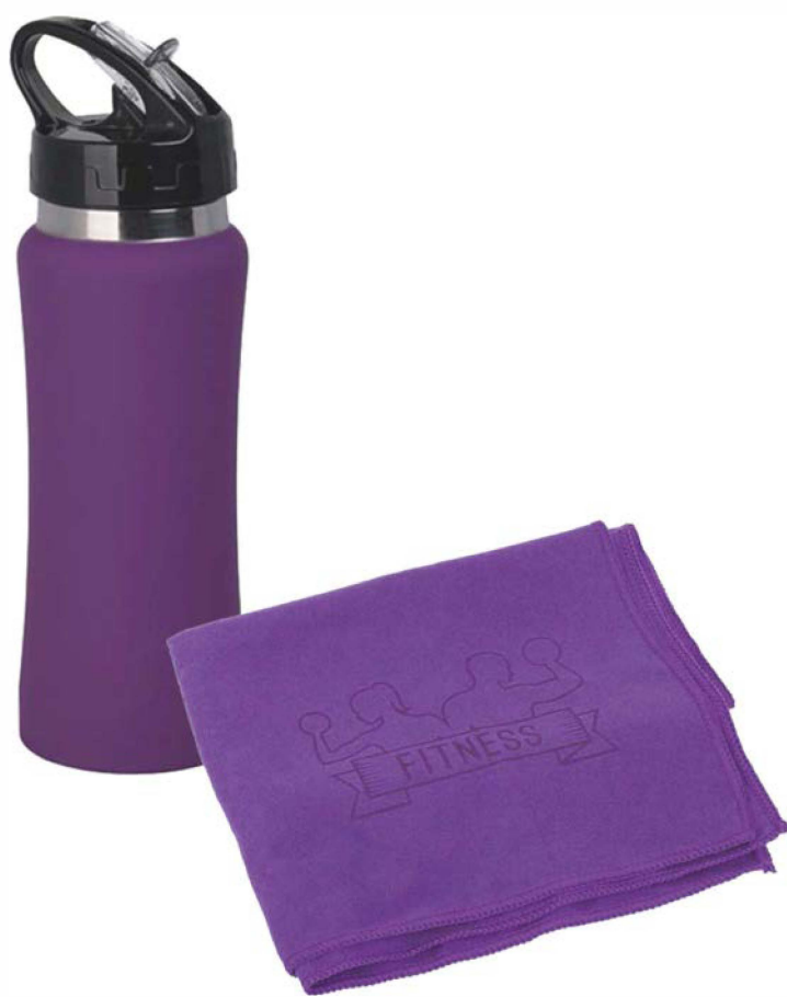
Полотенце для фитнеса «Тонус»