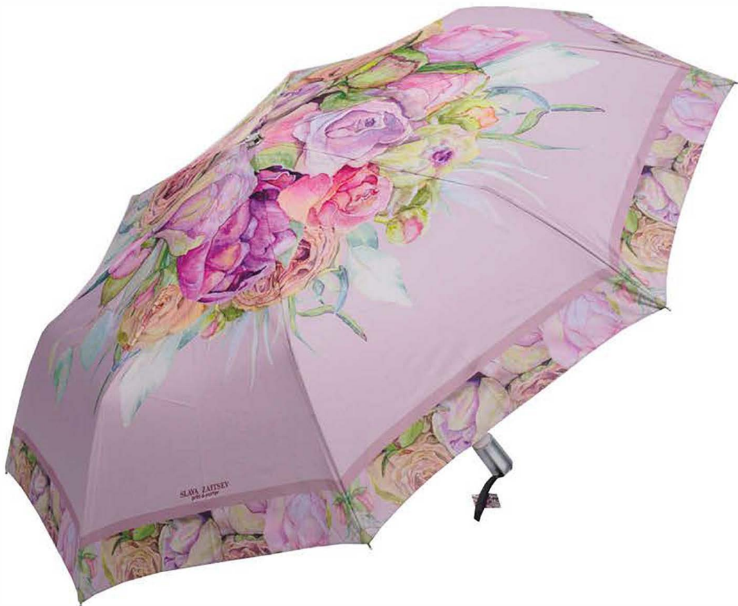
Зонт складной автоматический от Вячеслава Зайцева